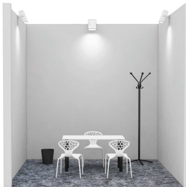
Un lato aperto / One open side

Immagini, arredi e misure hanno valore puramente indicativo. A seconda della metratura richiesta sarà inviato dettaglio con planimetria.